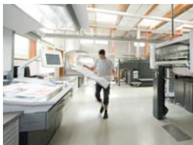
Sauberer Druck durch innovative Technik

Der von gugler* cross media eingesetzte ClimatePartner-Prozess für Druckerzeugnisse berücksichtigt Rohstoffe (Papier, Druckfarbe, Farbstoffe, Chemie, Feucht- und Reinigungsmittel) ebenso wie den Druckvorgang selbst (einschließlich Vorstufe und Weiterverarbeitung) und sogar die Auslieferung. Selbst der Personaleinsatz, der benötigt wird, um beispielsweise einen Geschäftsbericht zu drucken, wird in die Emissionsberechnungen einbezogen.