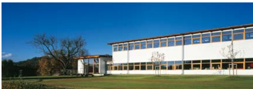
Ökologische Druckproduktion im Einklang mit der Natur

gugler* cross media hat sich in den letzten Jahren den Ruf eines Ökopioniers erworben. Mit greenprint* haben wir einen völlig neuen Standard in Sachen umweltverträgliche Druckproduktion gesetzt. Der Vorteil für Kunden, die klimaneutral drucken wollen, liegt auf der Hand: