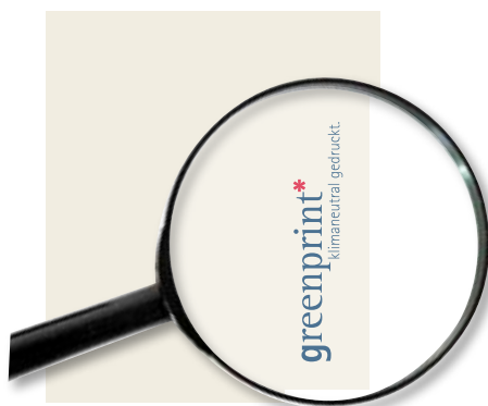
Ein neues Wertzeichen für Ihre Unternehmenskommunikation

Wo kaum Emissionen entstehen, muss auch kein großer Aufwand für den Ausgleich geleistet werden. Bei einer durchschnittlichen Druckproduktion liegt der für die Neutralisierung errechnete Betrag bei weniger als 1% Prozent der Gesamtsumme.